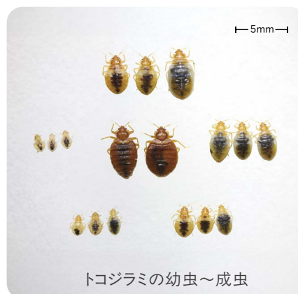
トコジラミの幼虫～成虫

潜伏場所周りに市販の昆虫用粘着トラップを配置して、捕獲の有無から生息状況を調べる方法があります。トコジラミの形、大きさ、色は、成長段階により少し異なりますので、粘着トラップによる確認の際には、右の写真を参考にして下さい。